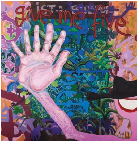
Nicolae Comănescu - Give me five