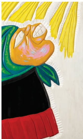
Dumitru Gorzo - VII