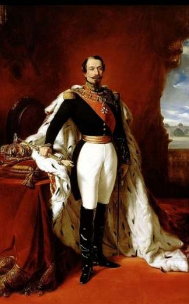
Napoleon al III-lea

„După dubla alegere a lui Alexandru Ioan Cuza, Napoleon al III-lea a făcut o declarație aproape senzațională pentru acea vreme referindu-se direct la Principatele Române și anume că interesul Franței este pretutindeni unde trebuie să învingă o cauză justă și civilizatoare.”