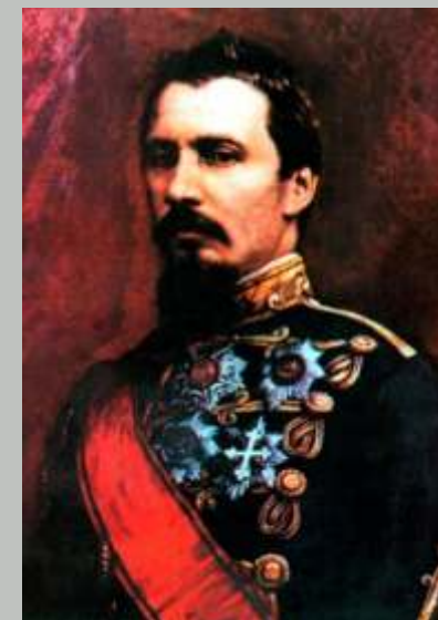
Alexandru Ioan Cuza