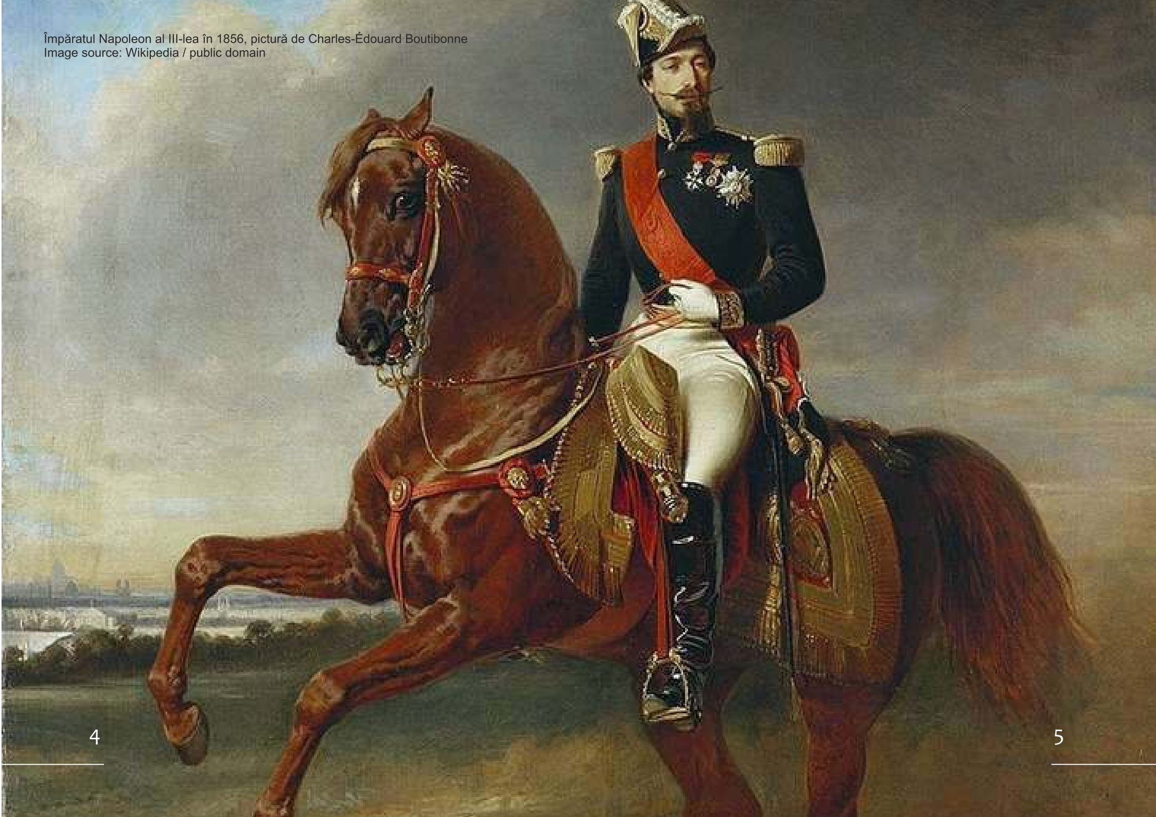
Împăratul Napoleon al III-lea în 1856, pictură de Charles-Édouard Boutibonne